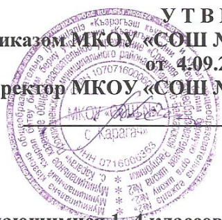
График посещения столовой обучающимися 1-4 классов МКОУ «СОШ №2 с. Карагач» на 2020 - 2021 учебный год.